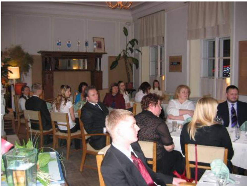
Tartu Ülikooli kohviku kaminasaal