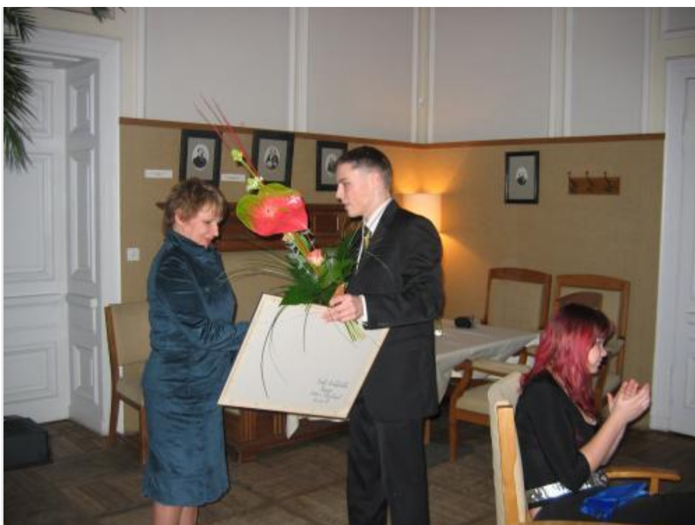
Sirje võtmas vastu stipendiaatide kingitust